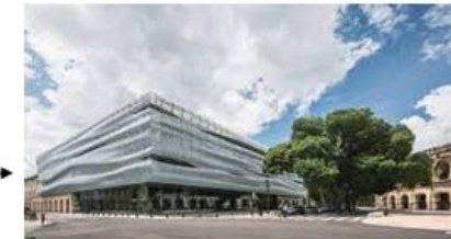
Le Musée de la Romanité à Nîmes